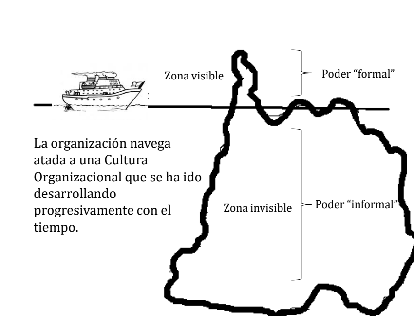
Figura 1: El ‘iceberg’ organizacional.

Por su parte, un valor, es una cualidad que tiene una persona que integra una organización, por ejemplo su sencillez, alegría, responsabilidad, honradez, puntualidad, etc. Los valores también pueden ser negativos (algunos lo llaman antivalores).